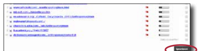
Seite der Ergebnisse und Liste der Quellen - Funktion, um eine Quelle zu IGNORIEREN

Nehmen Sie dann die erforderlichen Korrekturen vor, um ein Dokument ausreichender Qualität zu erhalten.