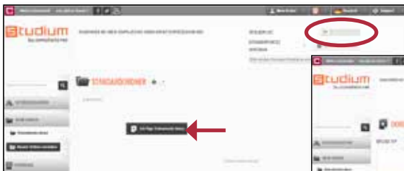
Startseite mit Liste der Dokumente

Klicken Sie auf Dokument hinzufügen , um Ihre erste Arbeit zu analysieren, wählen Sie dann das Dokument aus und bestätigen Sie den Ladevorgang.