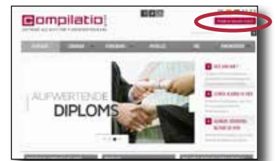
Startseite von Compilatio.net