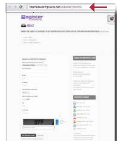
Formular zur sicheren Erfassung

Achtung: Vergessen Sie nicht, alle Ihre Dateien als Anlage beizufügen und im Betreff Ihrer E-Mail die Kennung der laufenden Erfassung anzugeben, die im linken Teil des Online-Formulars angegeben wird.