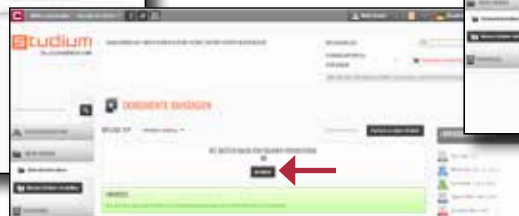
Seite zum Laden der Dokumente, mit Angabe der unterstützten Dateitypen