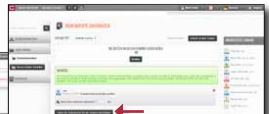
Fortsetzung der Seite zum Laden der Dokumente - Bestätigung des Ladevorgangs